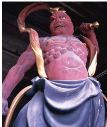
仁王像 (市指定有形文化財) Guardian god "Nio-zo" (City designated cultural assets)