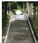
祖師道への参道 The approach to Soshido