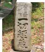
一切経蔵の碑 The monument of Issaikyozo

ハイキングコース入口 (岩本山公園へ) Hiking course entrance for Iwamotoyama Park